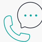
Interprétation par téléphone